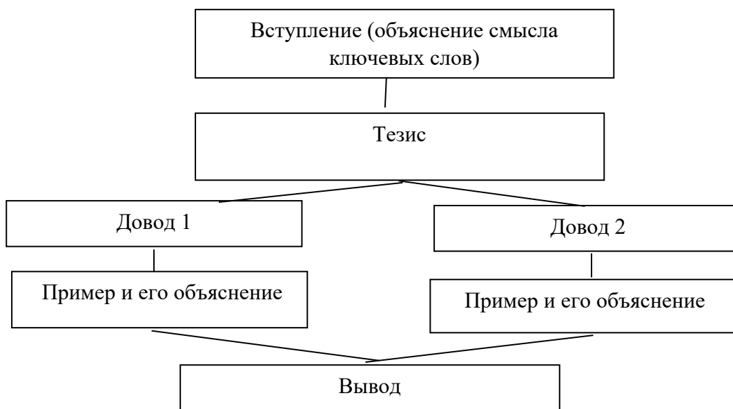
Рис. 1. Алгоритм создания рассуждения

Схема построения рассуждения с использованием противопоставления будет такой: